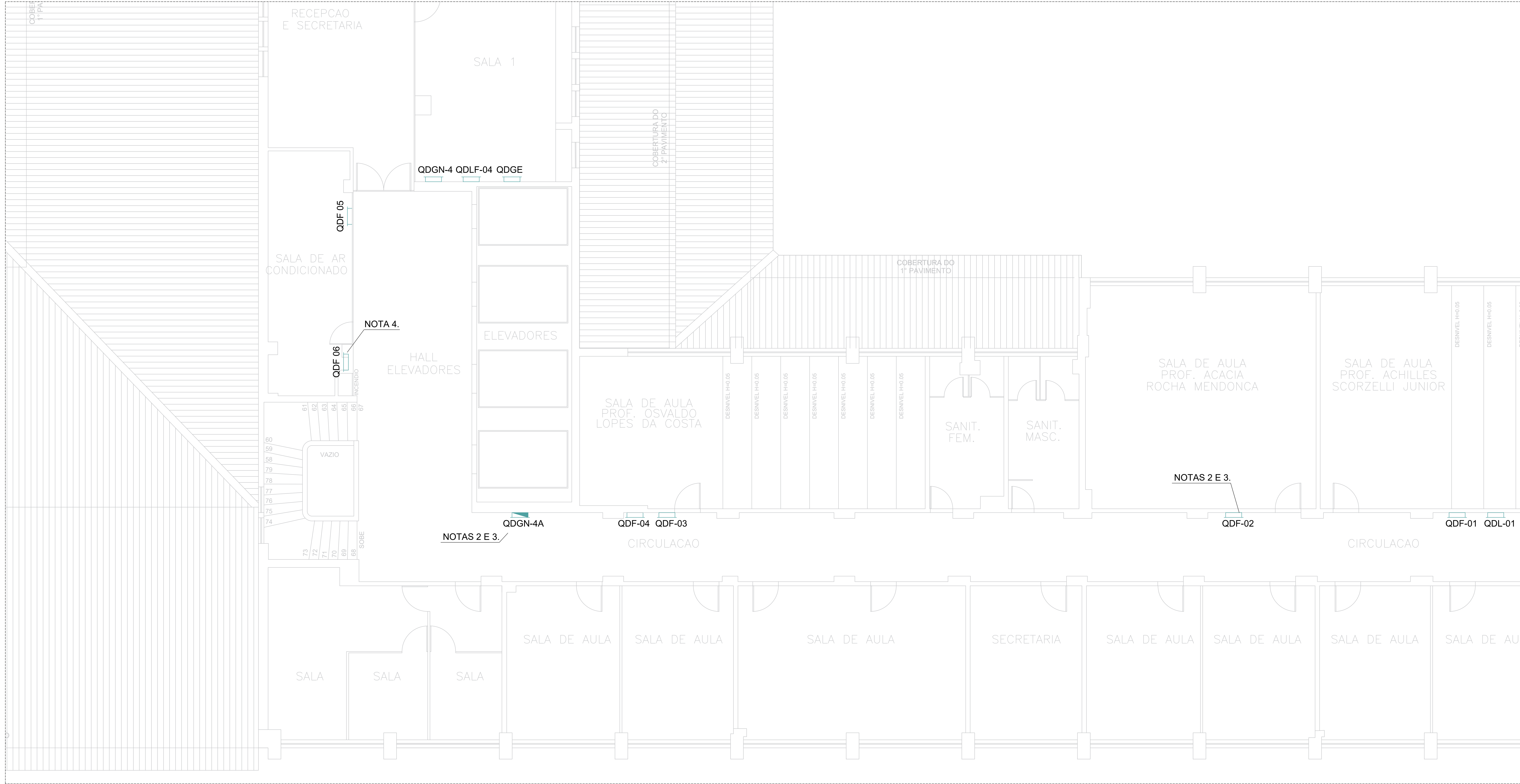
1 PLANTA BAIXA 4º PAVIMENTO